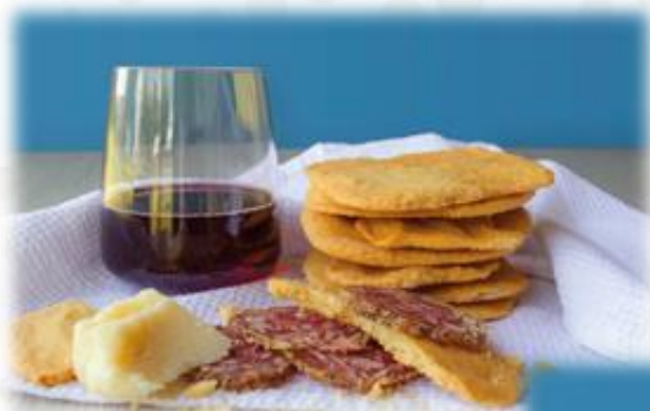
Schiacciatine di riso

Grissini mantovani all'olio extravergine di oliva