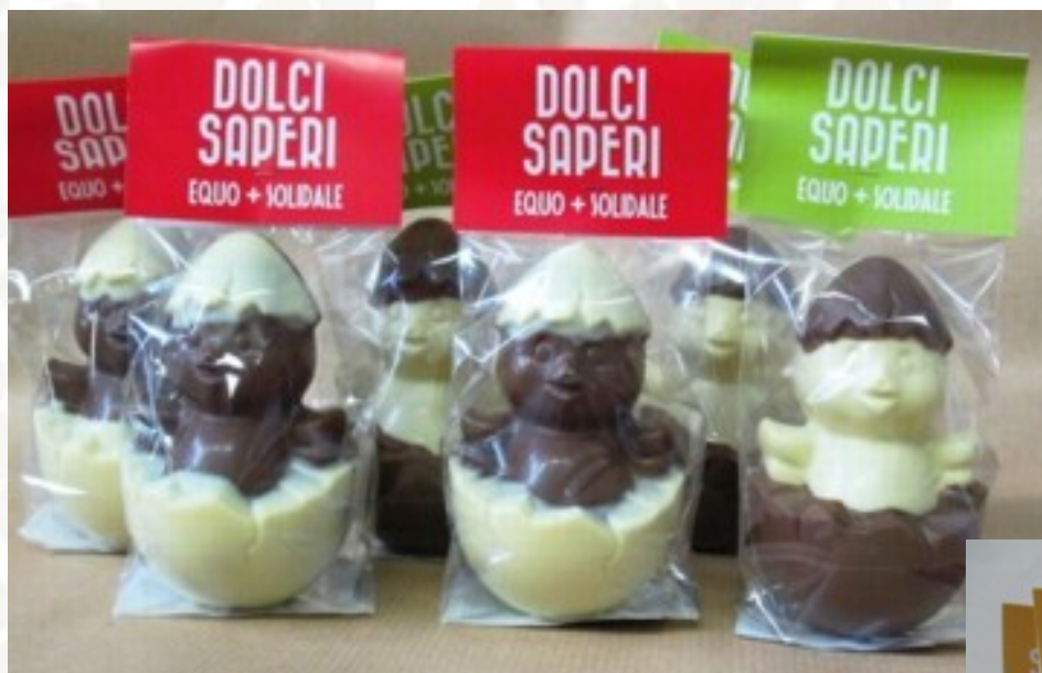
FIGURE DI CIOCCOLATO